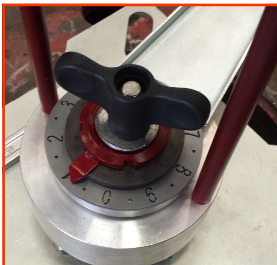
INDEX D'AJUSTEMENT DE FREINAGE